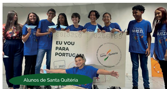
Alunos de Santa Quitéria