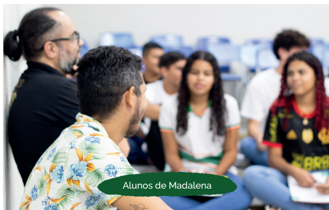
Alunos de Madalena

As atividades, realizadas de 5 a 20 de junho, contribuíram para aprimorar as habilidades socioemocionais dos participantes, como a autoconfiança e a responsabilidade profissional e pessoal, competências fundamentais no mercado de trabalho. Foi utilizada uma oficina de artes cênicas que possibilitou aos 30 participantes das escolas Alfredo Machado, de Madalena, e José Rozeno, de Canindé, realizarem uma apresentação teatral aberta às comunidades.