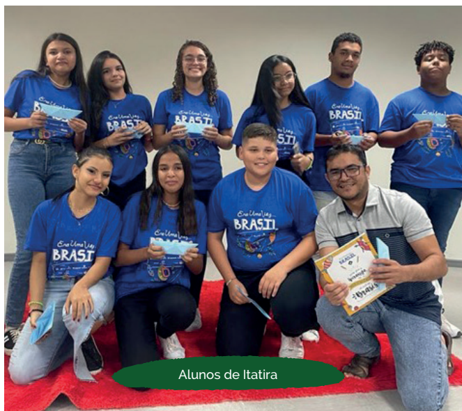
Alunos de Itatira