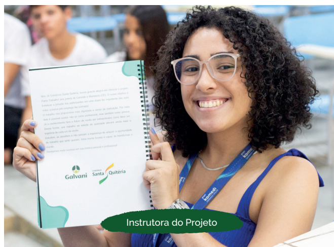
Instrutora do Projeto

O projeto, patrocinado pela Galvani, que compõe o Consórcio Santa Quitéria, é promovido pela Lei de Incentivo à Cultura, com realização do Ministério da Cultura. A organização ficou a cargo da Sancell Produções.