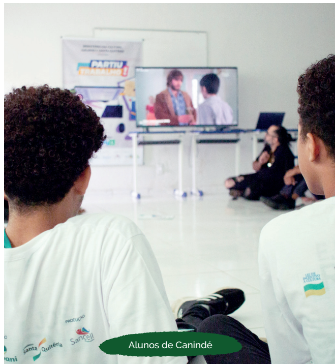
Alunos de Canindé