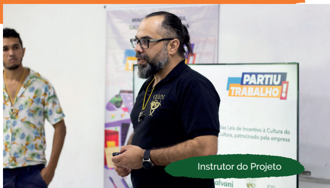
Instrutor do Projeto

Um dos principais desafios de todo jovem é conseguir a oportunidade para o primeiro emprego. Dentre os fatores que interferem, está a insegurança em relação à própria qualificação. Com base nessa situação, o Consórcio Santa Quitéria trouxe para os estudantes de Canindé e Madalena o projeto Partiu Trabalho!