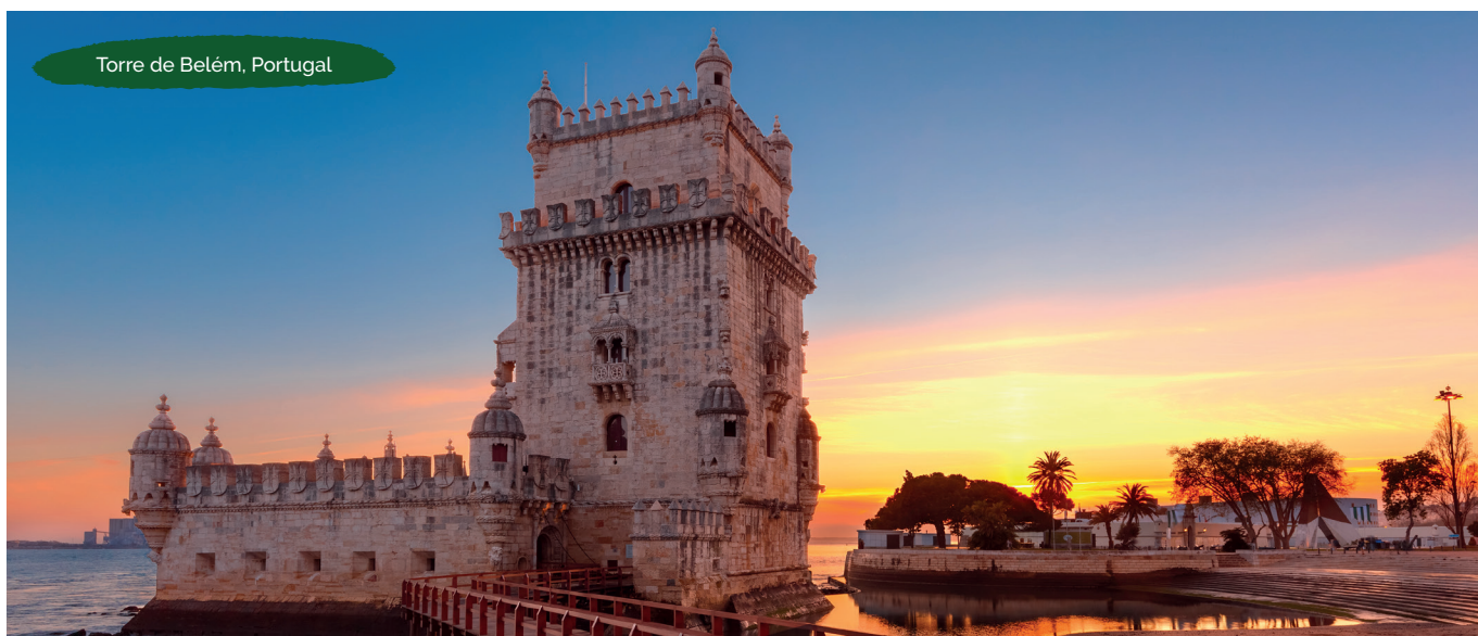
Torre de Belém, Portugal